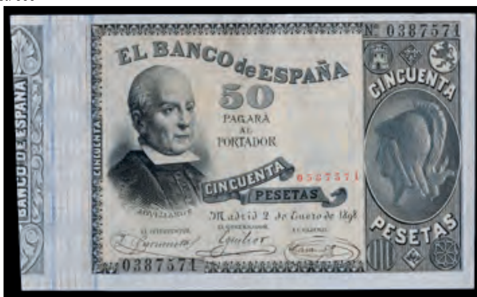
1567 1898. 50 pesetas. (Ed. 304) (Pick 47). 2 de enero, Jovellanos. Excepcional ejemplar que conserva parte de su apresto original. Muy bello. Se entrega encapsulado. Raro y más así. EBC . Est. 5.000