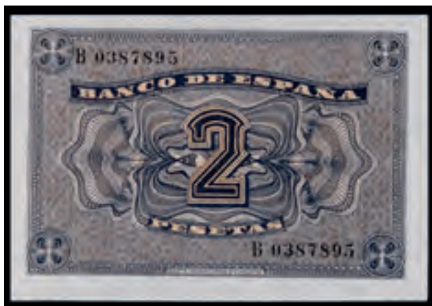
1591 1937. Burgos. 2 pesetas. (Ed. 426a) (Pick 105). 12 de octubre. Pareja correlativa, serie B, última emitida. Apresto original. Muy buenos ejemplares. Escasos y más así. S/C- . Est. 500 300.-