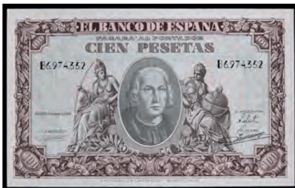
1598 1940. 100 pesetas. (Ed. 438a) (Pick 118a). 9 de enero, Colón. Serie B. Apresto original. Muy buen ejemplar. S/C- . Est. 150