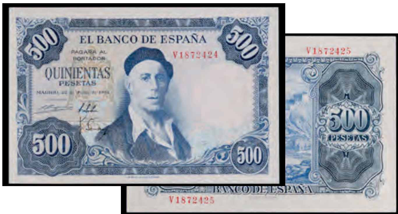
1610 1954. 500 pesetas. (Ed. 468b) (Pick 148a). 22 de julio, Zuloaga. Pareja correlativa, serie V, última emitida. Apresto original. Muy buenos ejemplares. Escasos así. S/C- . Est. 200