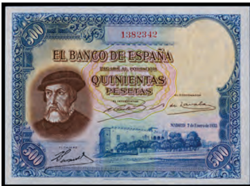
1575 1935. 500 pesetas. (Ed. 365) (Pick 89). 7 de enero, Hernán Cortés. Apresto original. Muy buen ejemplar. Se entrega encapsulado. S/C- . Est. 500