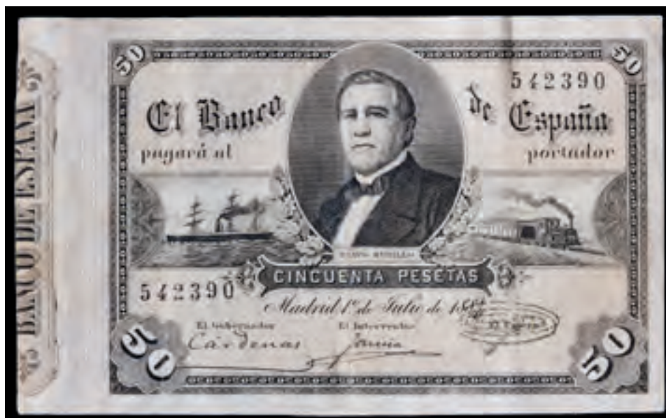
1563 1884. 50 pesetas. (Ed. 288) (Pick 30). 1 de julio, Bravo Murillo. Leves reparaciones. Punto de aguja por desgaste sobre su doblez central. Se entrega encapsulado. Raro. (MBC+). Est. 2.500