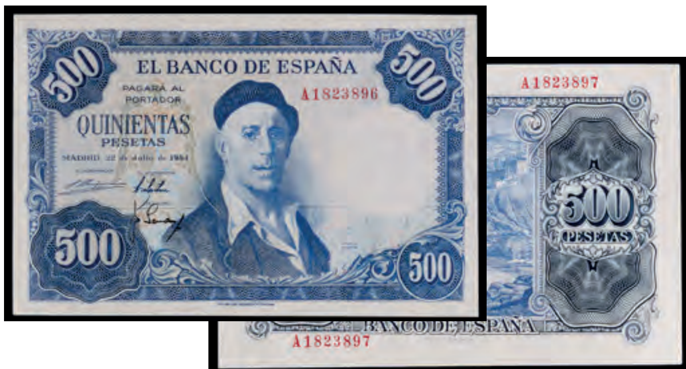
1609 1954. 500 pesetas. (Ed. 468a) (Pick 148a). 22 de julio, Zuloaga. Pareja correlativa, serie A. Apresto original. Muy buenos ejemplares. S/C- . Est. 150