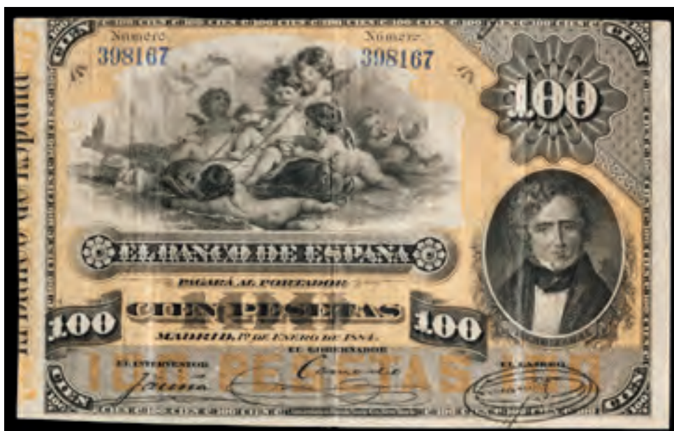
1562 1884. 100 pesetas. (Ed. 284) (Pick 26). 1 de enero, Mendizábal. Leves reparaciones. Puntitos de aguja. Se entrega encapsulado. Raro. (MBC+). Est. 1.000