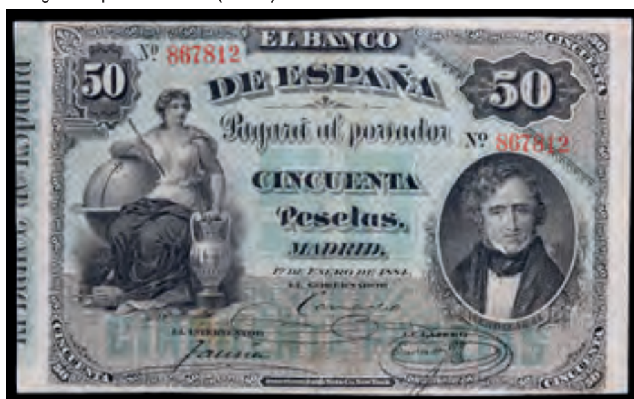
1561 1884. 50 pesetas. (Ed. 283) (Pick 25). 1 de enero, Mendizábal. Reparado. Manchitas en reverso. Se entrega encapsulado. Raro. (MBC+). Est. 1.000