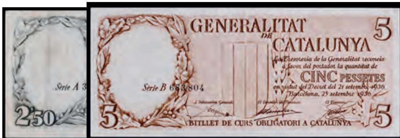
1577 1936. Generalitat de Catalunya. 2,50 y 5 pesetas. (Ed. 372 y 373) (Pick S591b y S592). 25 de septiembre. Lote de 2 billetes. El de 2,50 pesetas con numeración en negro. Manchitas en el de 2,50 pesetas. MBC-/EBC+ . Est. 150