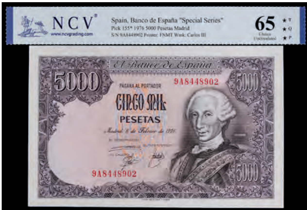
1615 1976. 5000 pesetas. (Ed. 475b) (Pick 155*). 6 de febrero, Carlos III. Serie 9A, de reposición. Encapsulado. Ínfimas marcas por manipulación descuidada. Apresto original. S/C. Est. 200