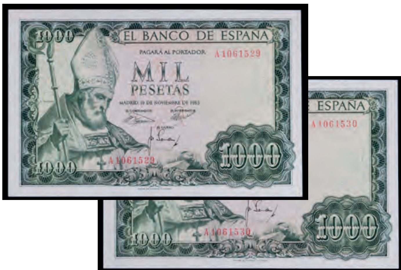
1614 1965. 1000 pesetas. (Ed. 471a) (Pick 151). 19 de noviembre, San Isidoro. Pareja correlativa, serie A. Apresto original. Muy buenos ejemplares. S/C-. Est. 70