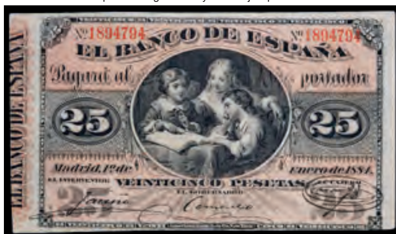
1560 1884. 25 pesetas. (Ed. 282) (Pick 24). 1 de enero, "Lección de Geografía". Levísimas reparaciones. Se entrega encapsulado. Raro. (MBC+). Est. 900