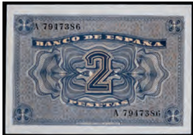
1590 1937. Burgos. 2 pesetas. (Ed. 426) (Pick 105). 12 de octubre. Serie A. Apresto original. Muy buen ejemplar. Escaso y más así. S/C- . Est. 175 120.-