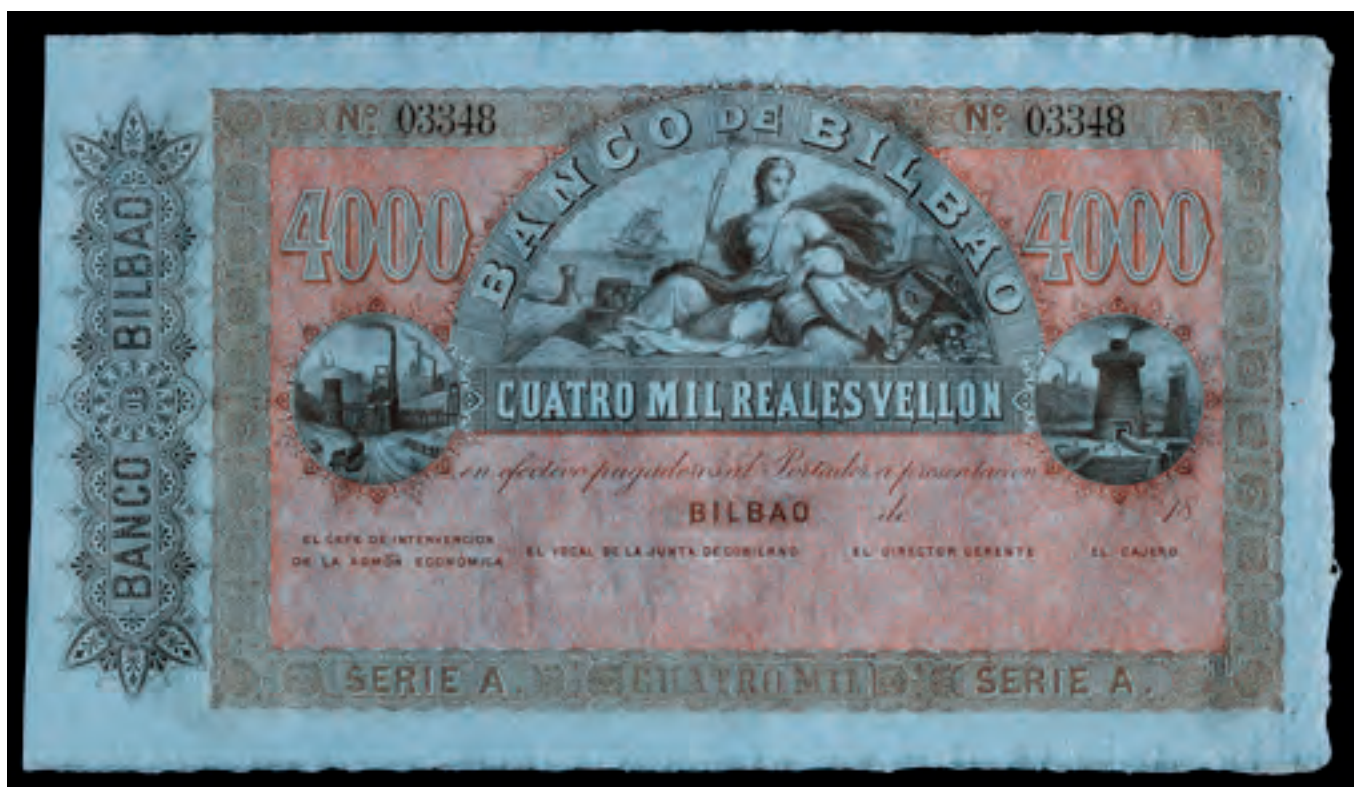
1559 (1857). Banco de Bilbao. 4000 reales de vellón. (Ed. 148) (Pick S256). (21 de agosto). Serie A. Sin firmas y con numeración. Apresto original. Muy buen ejemplar. S/C-. Est. 150