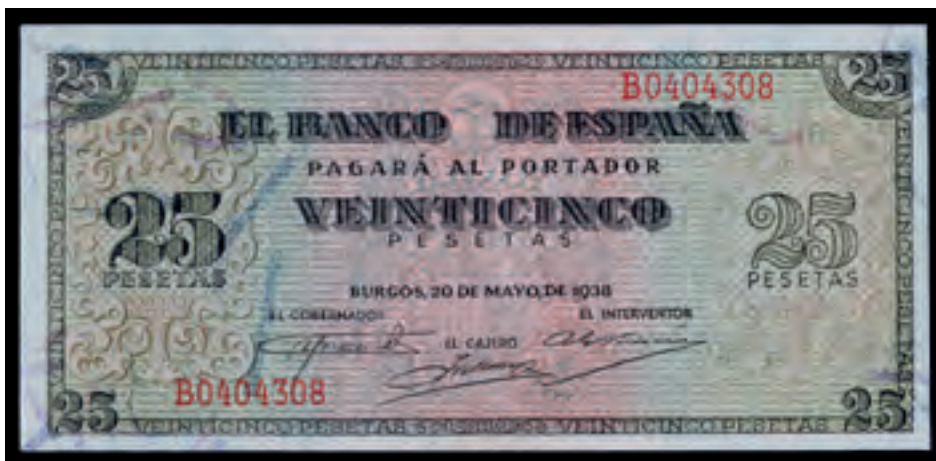
1592 1938. Burgos. 25 pesetas. (Ed. 430a) (Pick 111a). 20 de mayo. Serie B. Levísima y casi imperceptible ondulación central. Conserva prácticamente todos su apresto y relieve original. EBC+ . Est. 100 60.-