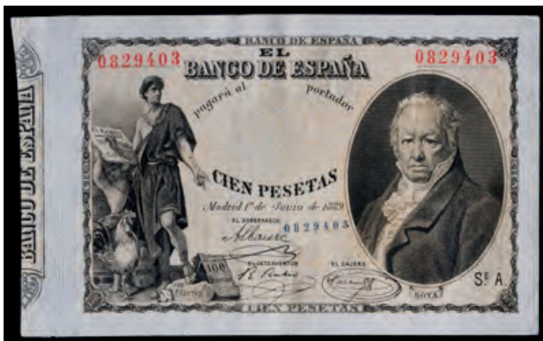
1565 1889. 100 pesetas. (Ed. 299) (Pick 41). 1 de junio, Goya. Muy buen ejemplar. Se entrega encapsulado. Raro y más así. EBC- . Est. 3.000