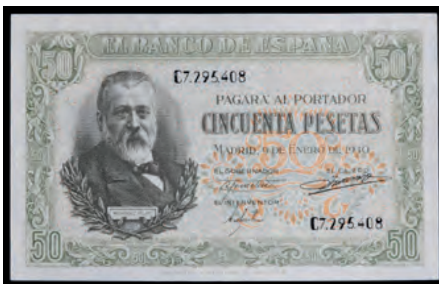
1597 1940. 50 pesetas. (Ed. 437a) (Pick 117a). 9 de enero, Menéndez Pelayo. Serie C. S/C- . Est. 70