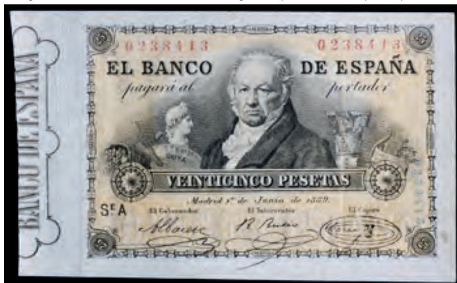
1564 1889. 25 pesetas. (Ed. 297) (Pick 39). 1 de junio, Goya. Levísimas reparaciones. Manchita y grafitos tapados en reverso. Se entrega encapsulado. Raro. (MBC). Est. 1.200