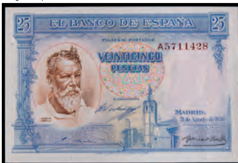
1576 1936. 25 pesetas. (Ed. 367a) (Pick 87b). 31 de agosto, Sorolla. Serie A. Apresto original. Muy buen ejemplar. S/C- . Est. 225