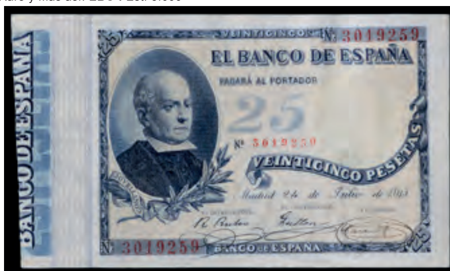
1566 1893. 25 pesetas. (Ed. 300) (Pick 42). 24 de julio, Jovellanos. Levisimas reparaciones en su margen superior e inferior. Punto de aguja tapado sobre su marca de agua. Sello tampón comercial en tinta negra sobre la tarlatana del reverso. Se entrega encapsulado. Raro y más así. (EBC-) . Est. 900