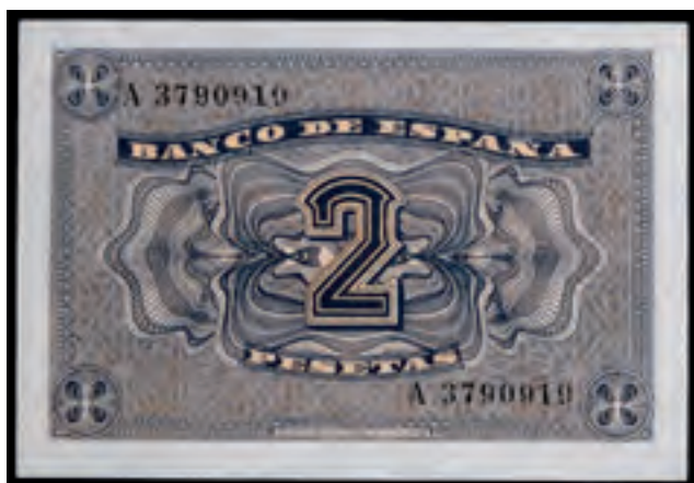
1589 1937. Burgos. 2 pesetas. (Ed. 426) (Pick 105). 12 de octubre. Serie A. Esquinas rozadas. Apresto original. Buen ejemplar. Escaso y más así. S/C- . Est. 175 120.-