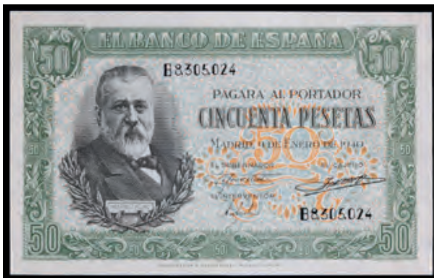
1596 1940. 50 pesetas. (Ed. 437a) (Pick 117a). 9 de enero, Menéndez Pelayo. Serie B. Levísimas marquitas por manipulación descuidada. Apresto original. S/C- . Est. 125