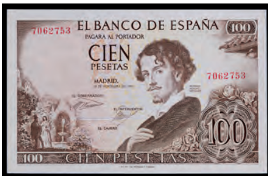
1613 1965. 100 pesetas. (J. A. Castellanos ErF1). 19 de noviembre, Bécquer. Sin serie y sin firma del cajero. Apresto original. Muy buen ejemplar. Escaso. S/C-. Est. 70